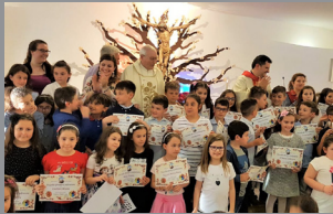
Pronti a scattare! pagg. 2-3