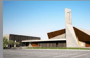
Work in progress pag 9