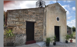
Riapertura di San Leonardo pag 10