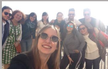
Vita in parrocchia pag 6