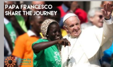
Dal territorio: Braccia Aperte ai migranti pag 7