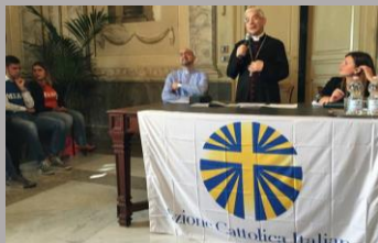
Assemblea diocesana di apertura di AC pagg 4-5