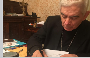
Work in progress pag 8