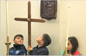
In preparazione alla Pasqua, pag. 3