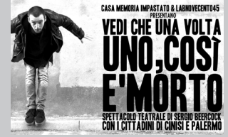
Dal territorio pagg 10, 11, 12