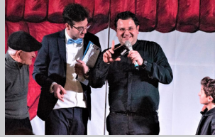
Speciale Carnevale pag 5