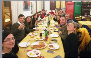
Vita parrocchiale Pagg. 6-7