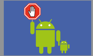
Parental Control Pag. 8