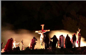
La Via Crucis Pag. 3