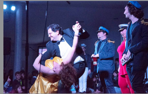
Speciale Carnevale Pag. 5